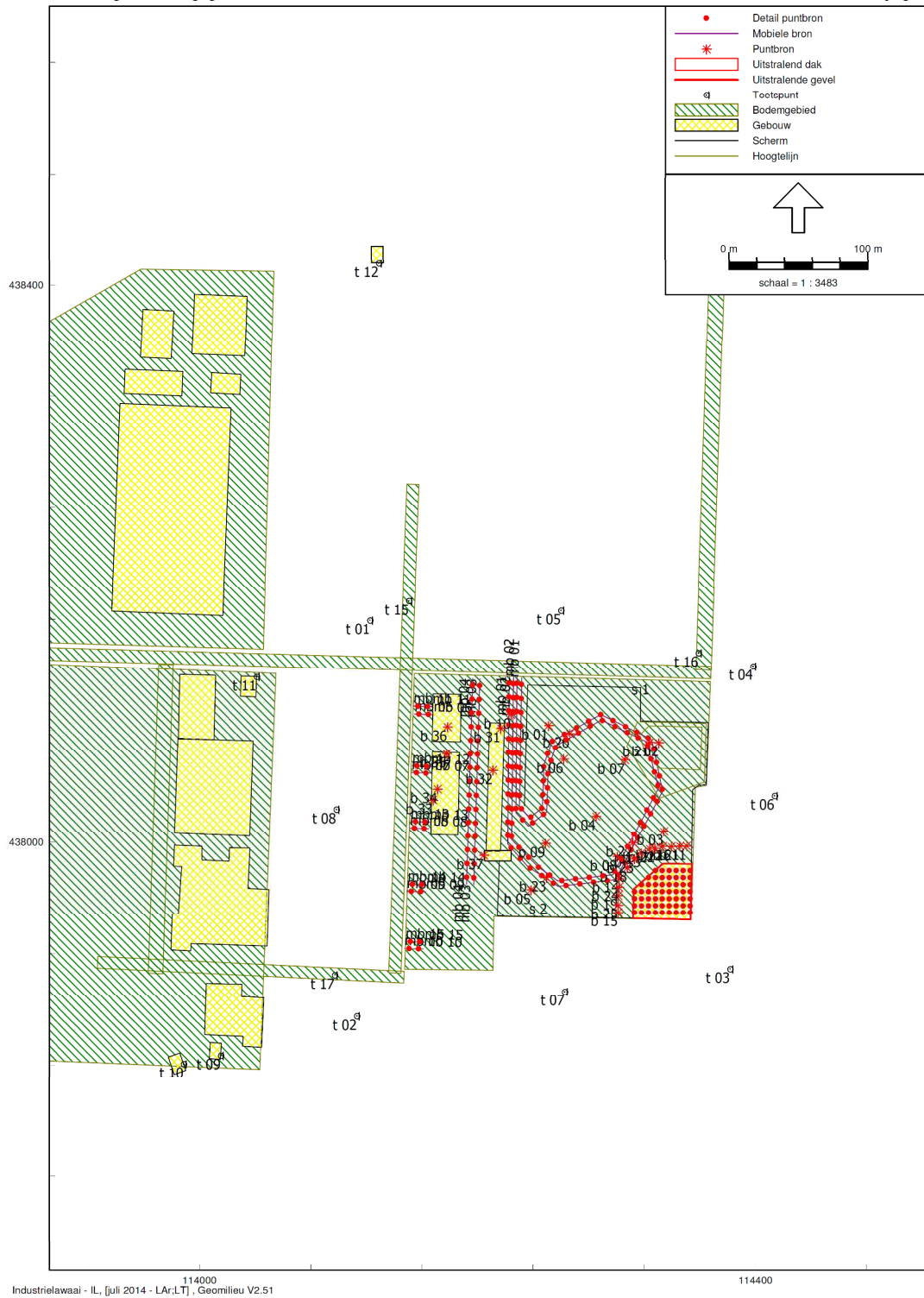
Figuur 1: Ligging controlepunten t15, t17 en t07.