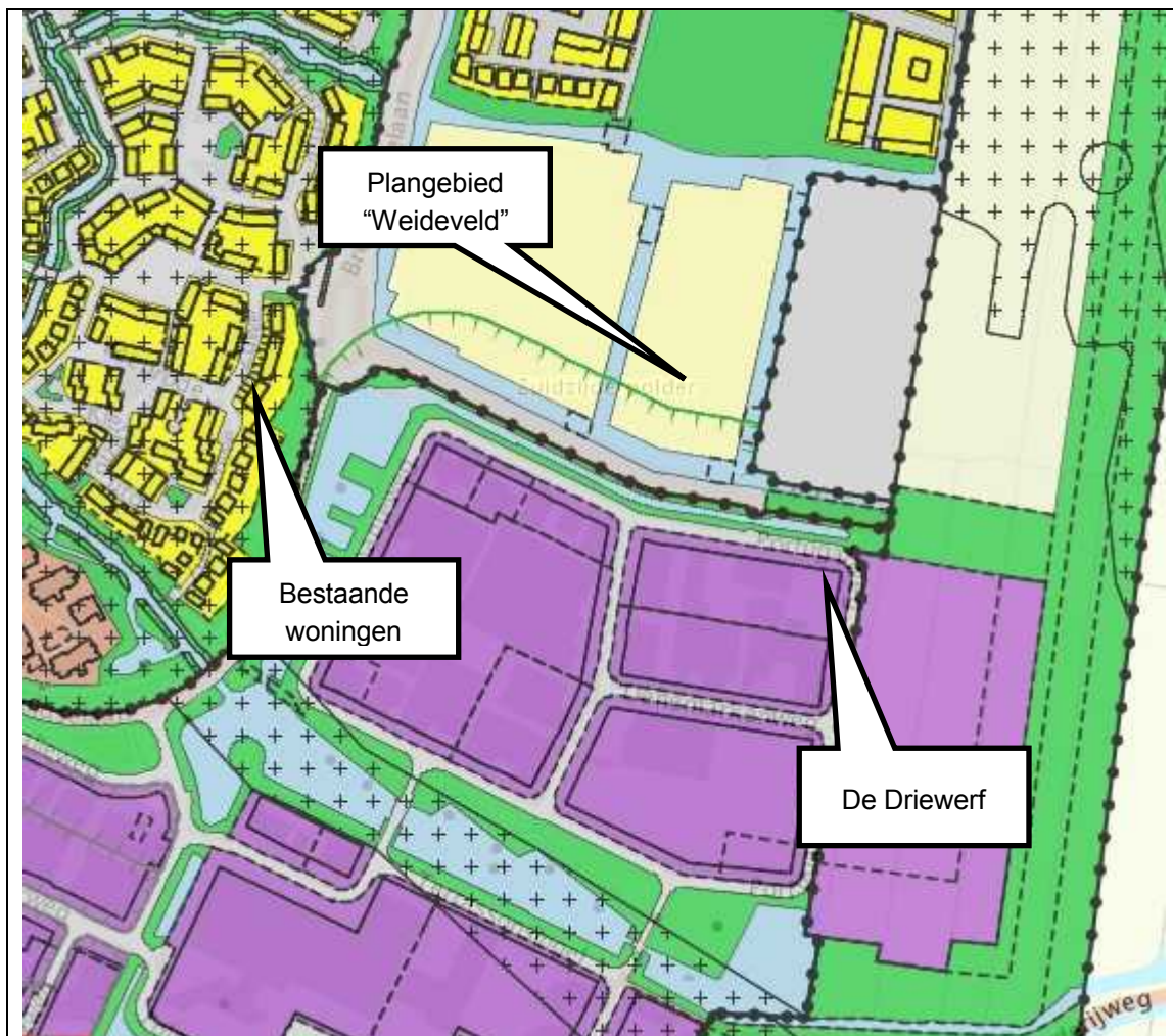
Figuur 1: Overzicht ligging De Driewerf en omgeving