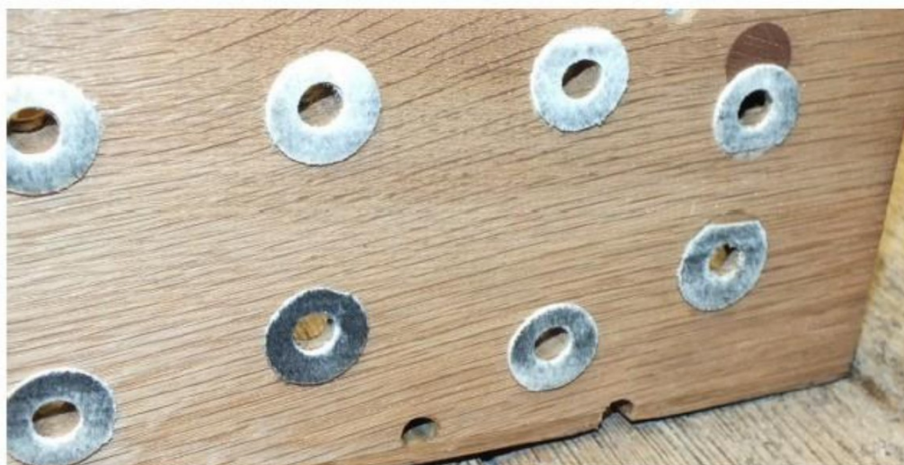
situatie onder de stok