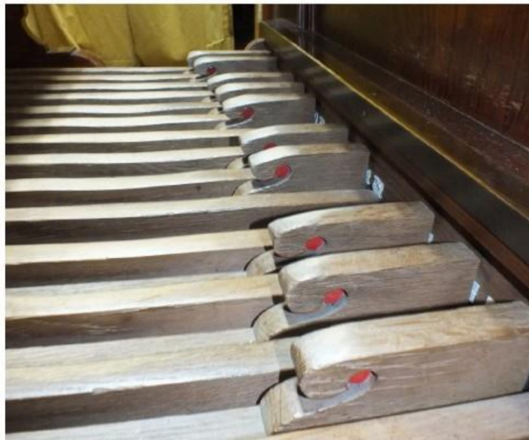
versleten beleg pedaalklavier