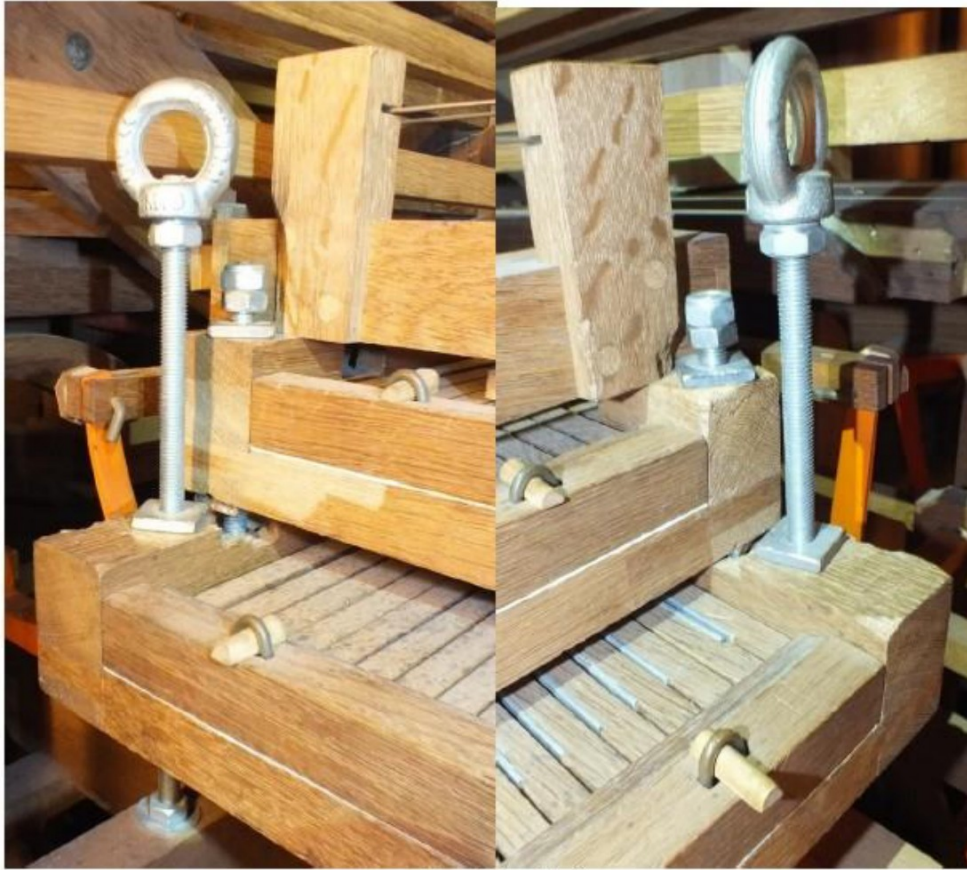
generale verstelling klavieren