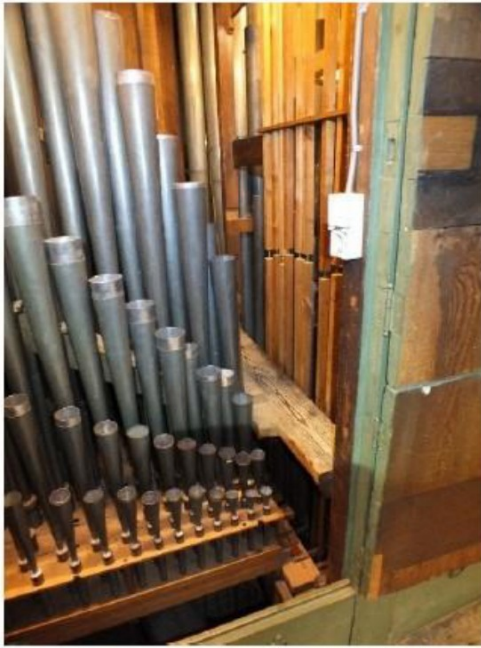
krappe toegang tot het Hoofdwerk