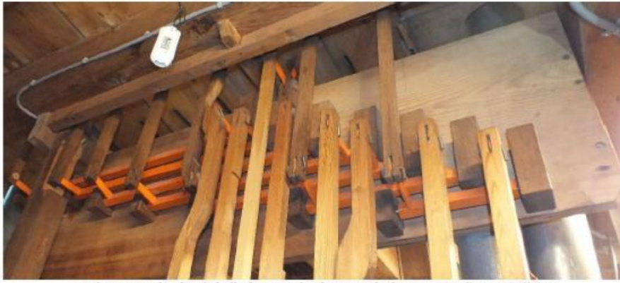
walsraam onder de winkelbaken van het bovenwerk: bron van speling en wrijving