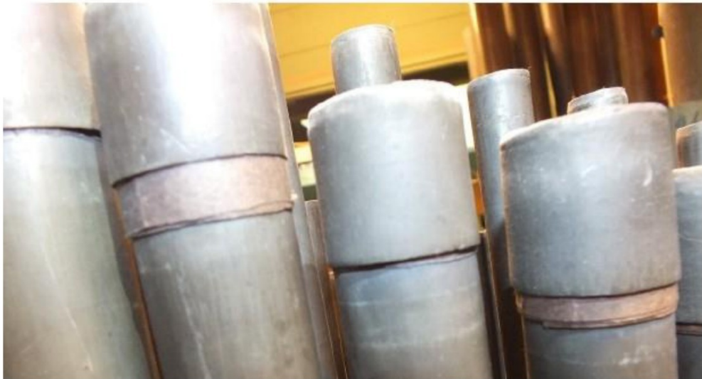
papier onder boeden vervangen door leer