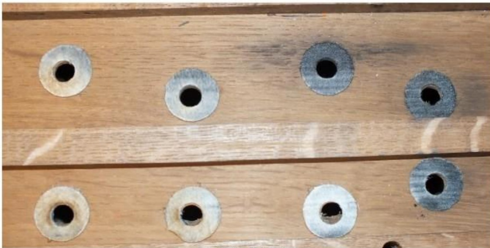
situatie op de lade