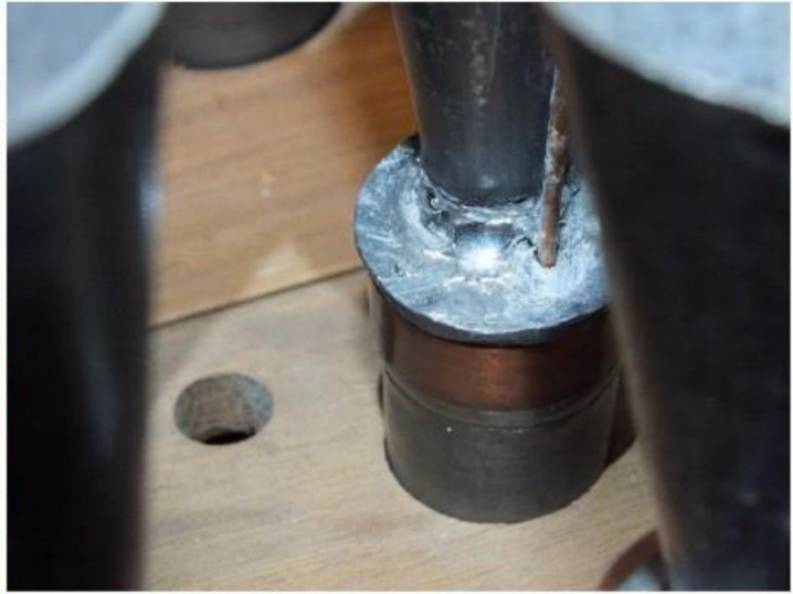
pijpwerk dat bij het betreden is beschadigd