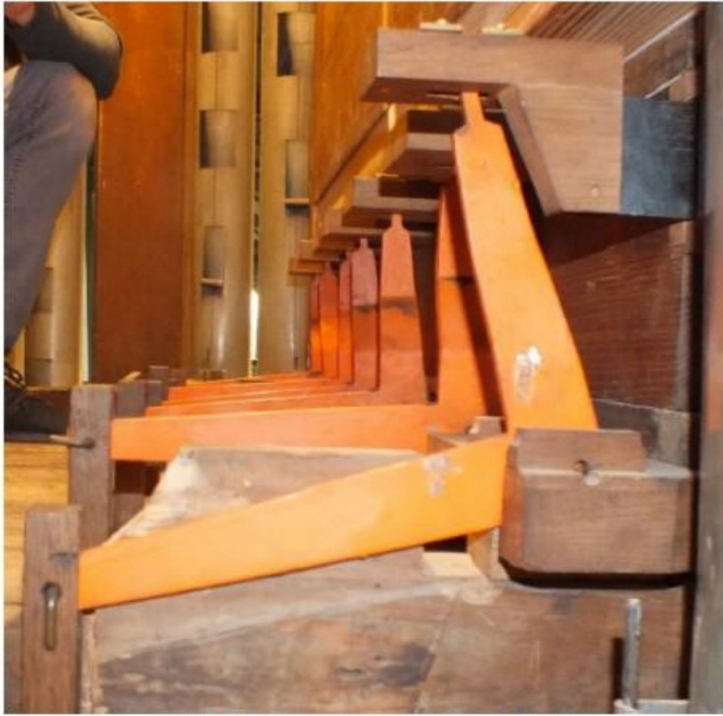
winkelbaken bovenwerk in AN- en AF-stand