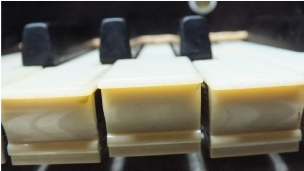
forse ontregelingen in de klavieren door de massieve walsborden