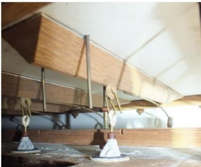
plaatsing van de veer op het ventiel