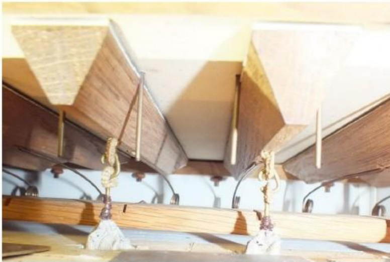
blik in de ventielkast van het Bovenwerk